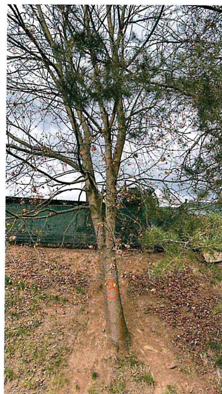
17) Dřeviny ke kácení: č.1 - javor 110 cm