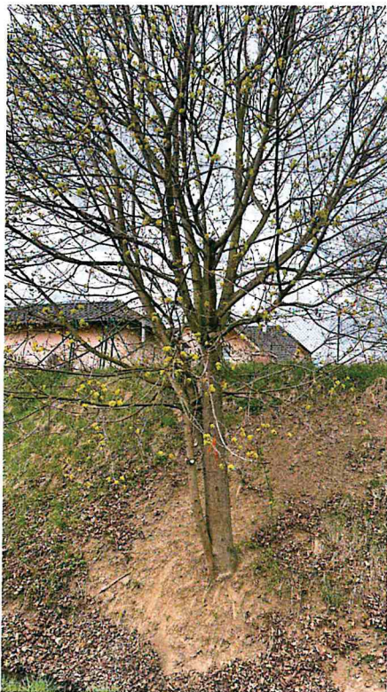
15) Dřeviny ke kácení: č.1 - javor 95 cm