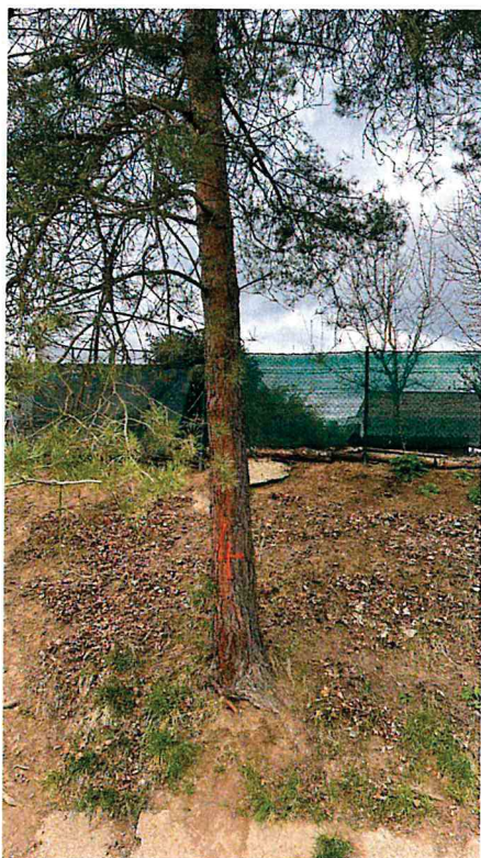
18) Dřeviny ke kácení: č.1 - borovice 125 cm