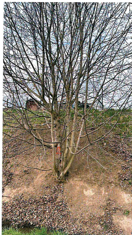
16) Dřeviny ke kácení: č.1 - javor 95 cm